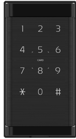
ES-L200 / ES-L200C

▶本書はお客様が製品をより便利かつ安全に使用できるように作成されています。本製品をご使用になる前に必ずよくお読みください。 ▶本製品はロッカー専用モデルです。内側から解錠することはできません。